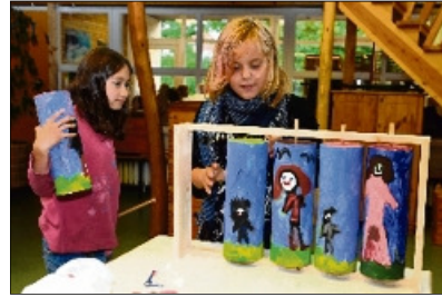
„Nabel-der-Welt“-Beiträge aus Bremen-Nord.